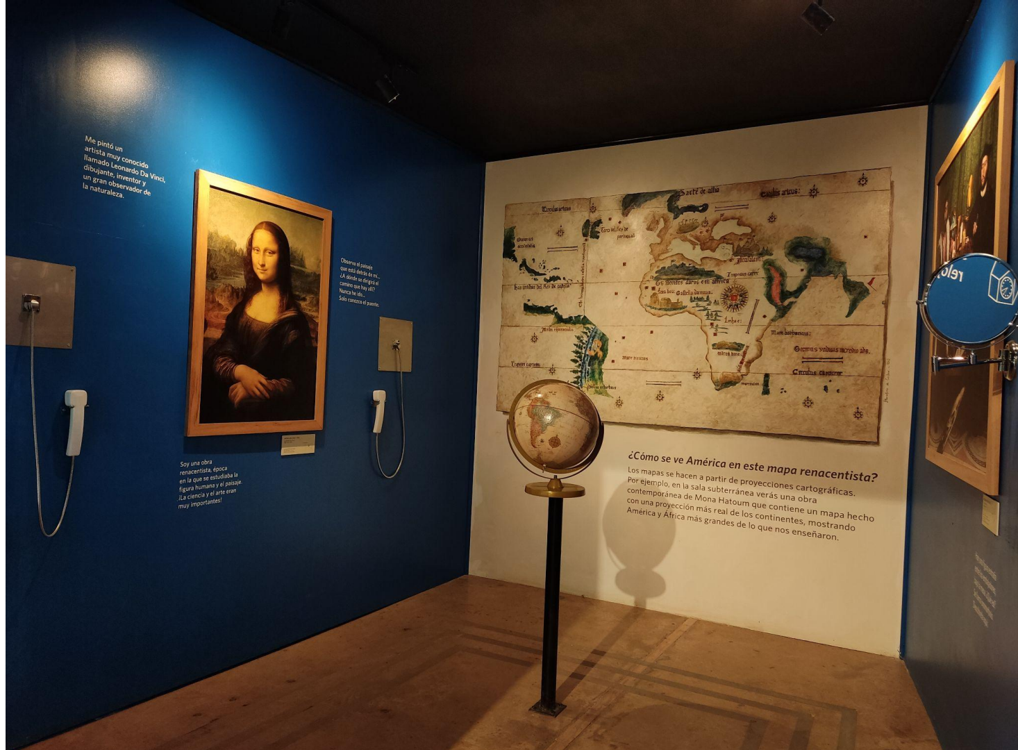
Sala principal: Mona Lisa y Renacimiento.